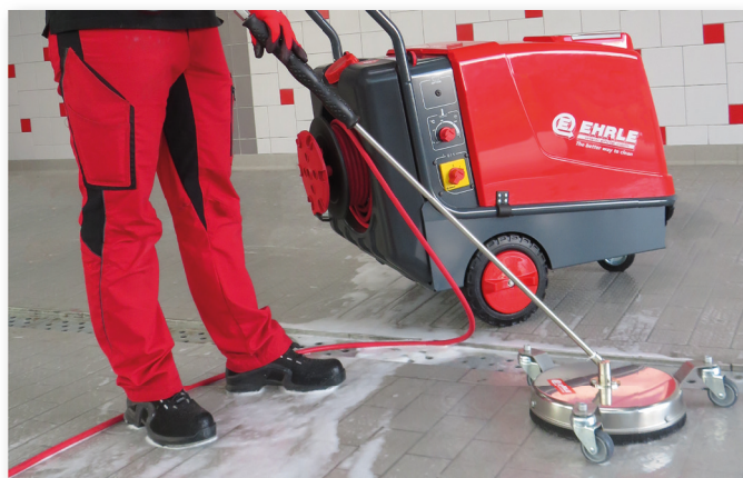
Oppervlakte reiniger RVS in gebruik Ø 300mm, Art. Nr. 394078