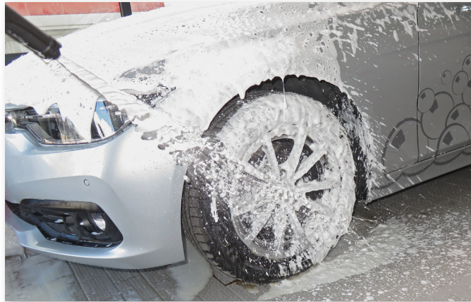
Autoreiniging met bevestigingsset SoftFoam lans, Art. Nr. 410702