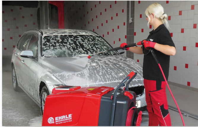
Autoreiniging met lans en roestvrijstalen vlakstraalsproeier