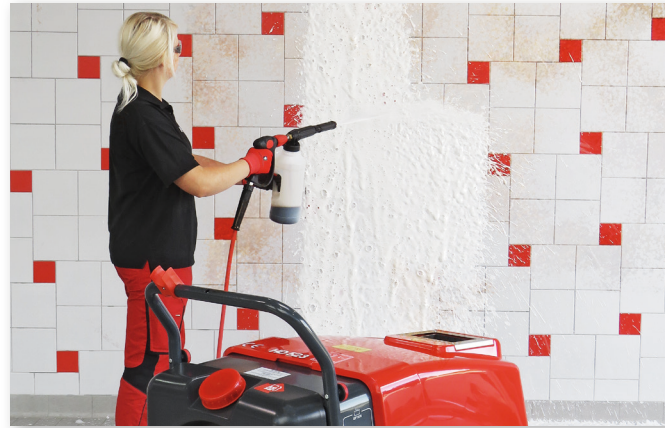
Voorverstuiving met bevestigingsset SoftFoam lans, Art. Nr. 410702