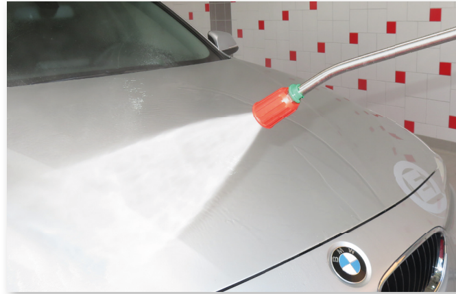
Hogedrukreiniging met lans en roestvrijstalen vlakstraalsproeier