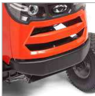
STALEN BUMPER & LED-KOPLAMPEN De stalen stootbumper vooraan maakt de zitmaaier nog duurzamer.