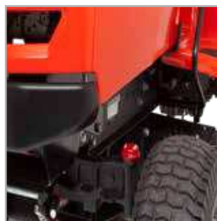
DUURZAME VOORAS Robuuste, pendelende, gietijzeren vooras voor een lange levensduur.