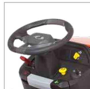
STUURWIEL Bedieningsinstrumenten met een kleurcode op het dashboard.