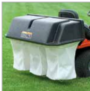
Grasopvangsysteem met 3 zakken