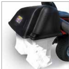
Grasopvangsysteem met 2 zakken