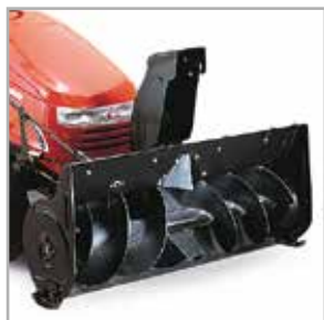
1 traps sneeuwrees