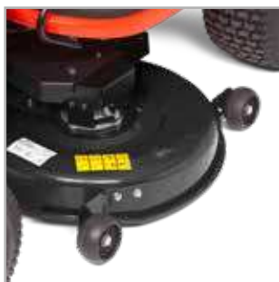
AAN HET CHASSIS OPGEHANGEN MAAIDEK Maaidek met 4 anti-scalpwielen en met een aansluiting voor een tuinslang.

Deze Regent™ zitmaaiers worden aangedreven door een betrouwbare Briggs & Stratton® motor. De bumper is geïntegreerd en de zitmaaier is voorzien van een modern instrumentenpaneel. De robuuste maaidekken en de zware gietijzeren voorassen garanderen een lange levensduur en hoge prestaties.